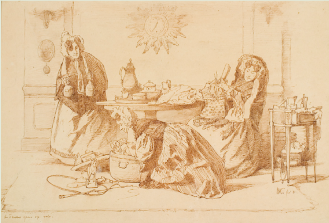
De tantes gaan op reis (1881) door Alexander Hugo Bakker Korff

Soort advies: Rijkscollectie Adviesdatum: 18 september 2023 Periode bezitsverlies: 1940-1945 Oorspronkelijke eigenaar: particulier Plaats bezitsverlies: in Nederland