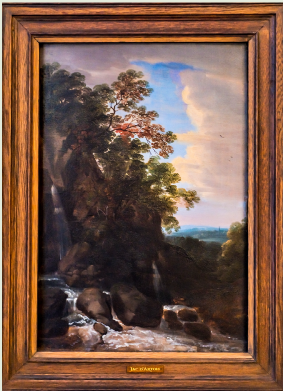
'Landschap met een waterval' van de kunstenaar Jacques d'Arthois