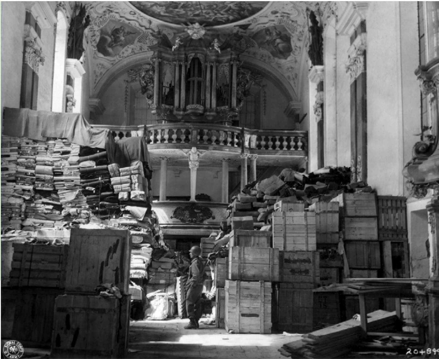
Een Amerikaanse soldaat in een kerk te Ellingen, een van de honderden bergplaatsen van het naziregime.