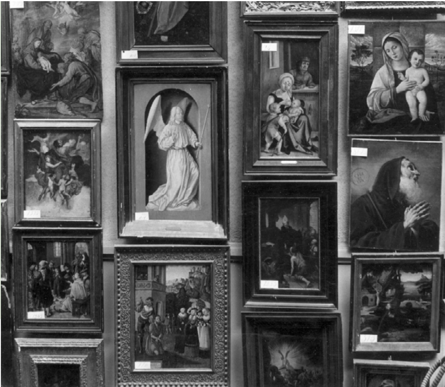
Nederlands kunstbezit, gerecupereerd uit Duitsland, Amsterdam 1950.