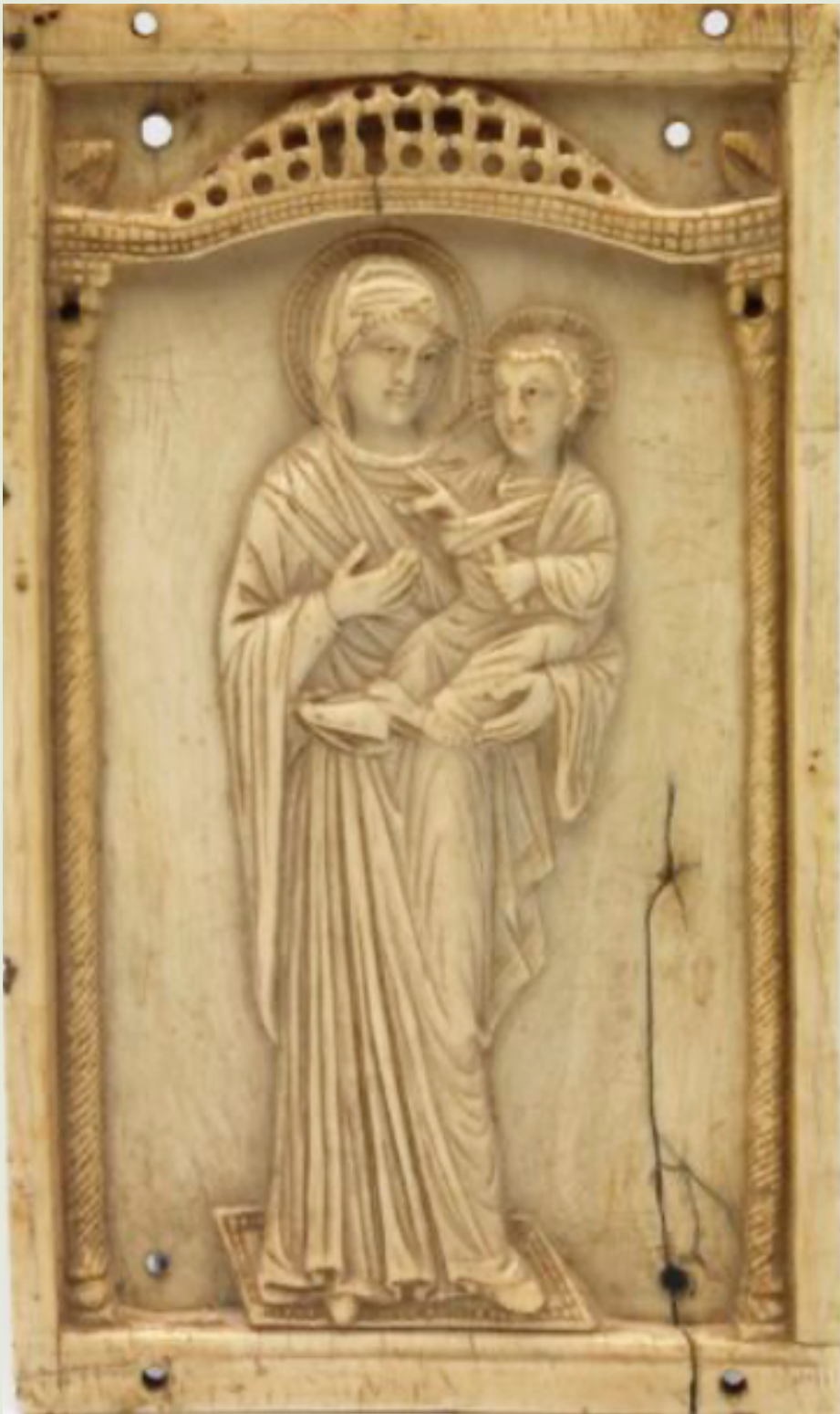
Hodegetria of Maria met kind (maker onbekend)