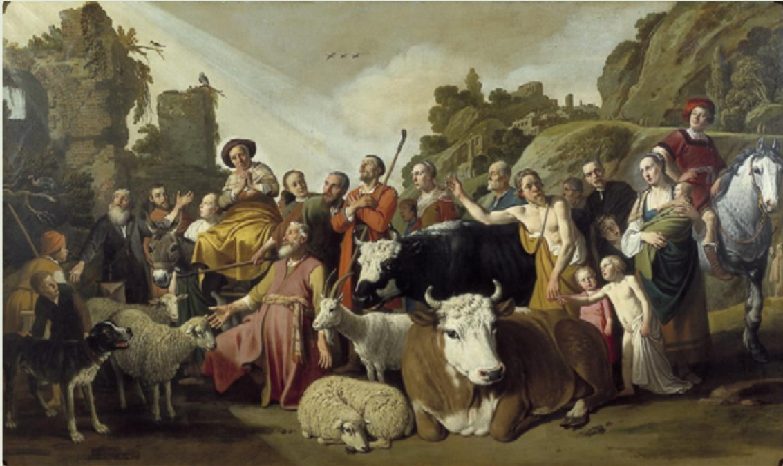
God verschijnt aan Abraham te Sichem door Nicolaes (Claes) Moeyaert